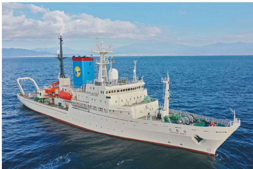
(写真1) 学術研究船「白鳳丸」

※2 海底電位磁力計（OBEM: Ocean Bottom Electromagnetometer）：海底地震計と同様、船舶により海底に設置し、一定期間磁場及び電場を測定する。取得した磁場及び電場データから海底下の電気の流れやすさを可視化し、流体の分布を把握することができる。