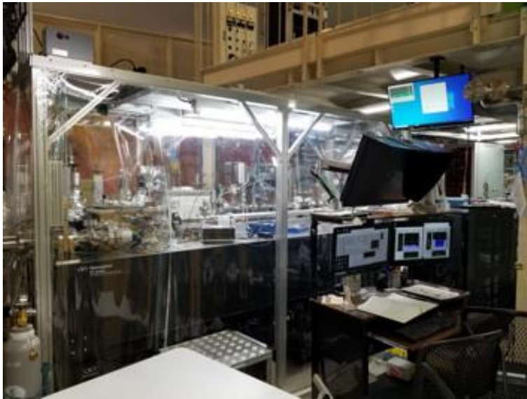
【固体有機物分析チーム】 高エネルギー加速器研究機構に設置された軟 X 線顕微鏡。固体有機物の構造や分布を明らかにする。