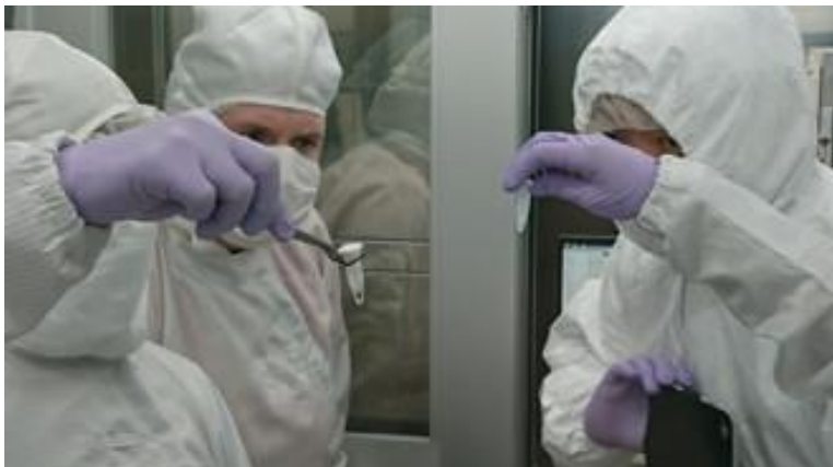
【可溶性有機物分析チーム】 九州大学地球外有機物専用クリーンルームでの分析リハーサル。