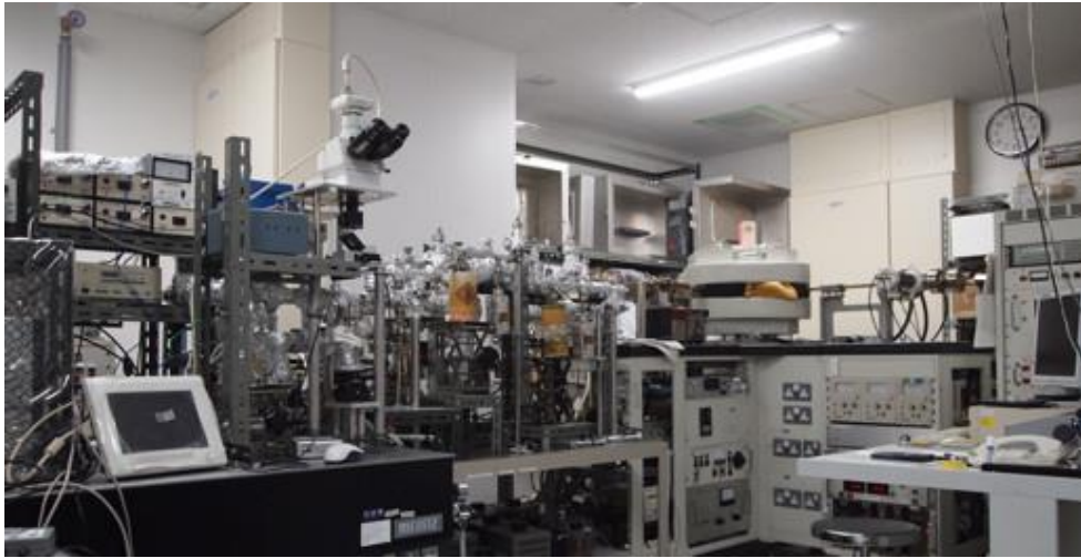
【揮発性成分分析チーム】 コンテナから採取されたガスや固体粒子中のガスに含まれる希ガスを分析する質量分析装置（九州大学）。