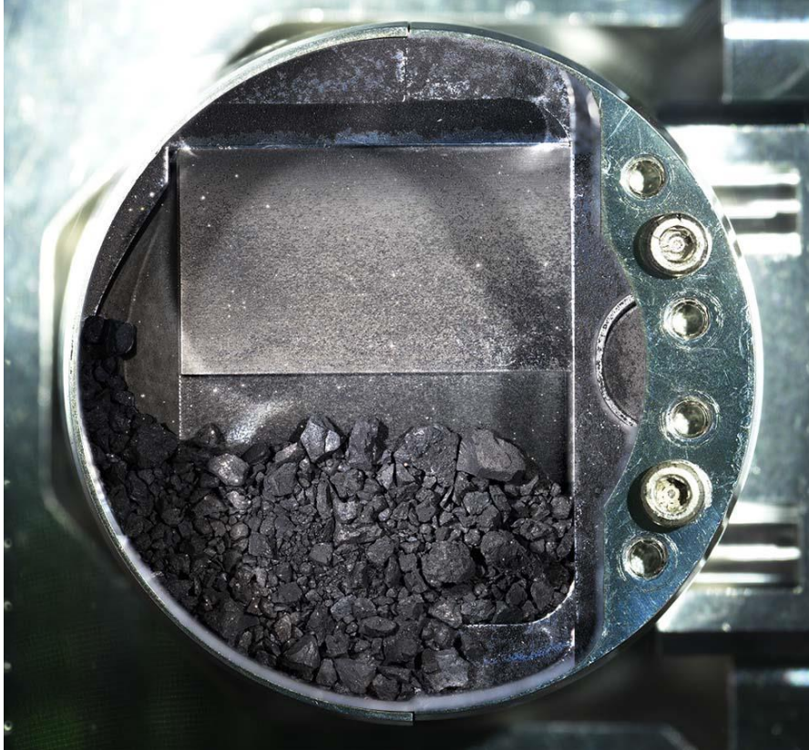
「はやぶさ2」 サンプルキャッチャー内の粒子。第一回目のタッチダウン時に採取されたものと考えられる。キャッチャー円筒の直径は48 mm。